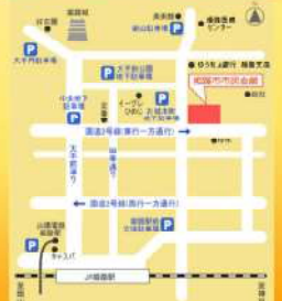
姫路市市民会館へのアクセス