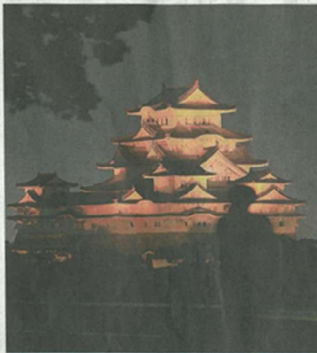
認知症への理解を広めようとオレンジ色にライトアップされた姫路城＝姫路市本町

世界アルツハイマーデーの21日、認知症への地域の理解や支えを呼びかけようと、イメージカラーであるオレンジ色のライトアップが各地で行われた。姫路市の世界文化遺産・国宝姫路城も日没後、温かなオレンジ色に照らされた。