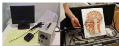
嚥下検査用経鼻内視鏡