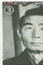
③ 荷役のつた現在の「神戸港区波止場

ての構図を、周囲の関係者が利用している形だ。意識の中から消え去ったわ「港に関わるシノギ(資)けではない。||呼称略||