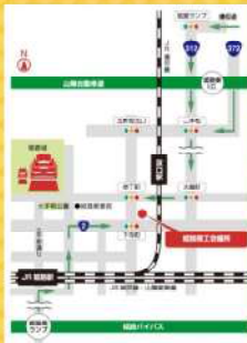
姫路商工会議所へのアクセス

JR姫路駅 山陽電車姫路駅から北東へ 徒歩20分 神姫バス ①日比町行乗車→商工会議所前下車 ②高島神社行、夕陽丘行、別所行乗車→坂田町下車 ③山陽自動車 姫路東ICより 矢印の方向へ ④姫路バイパス 矢印の方向へ(所要時間約15分) ⑤播但連絡道路 矢印の方向へ(所要時間約15分) ※姫路商工会議所は駐車場がございます。(有料)